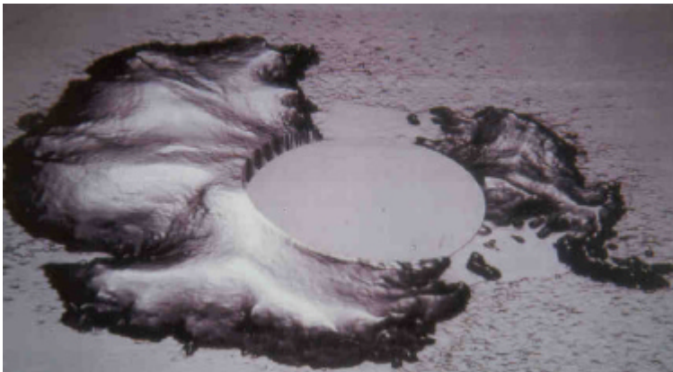
Höhenprofil der Antarktis (ERS-1)